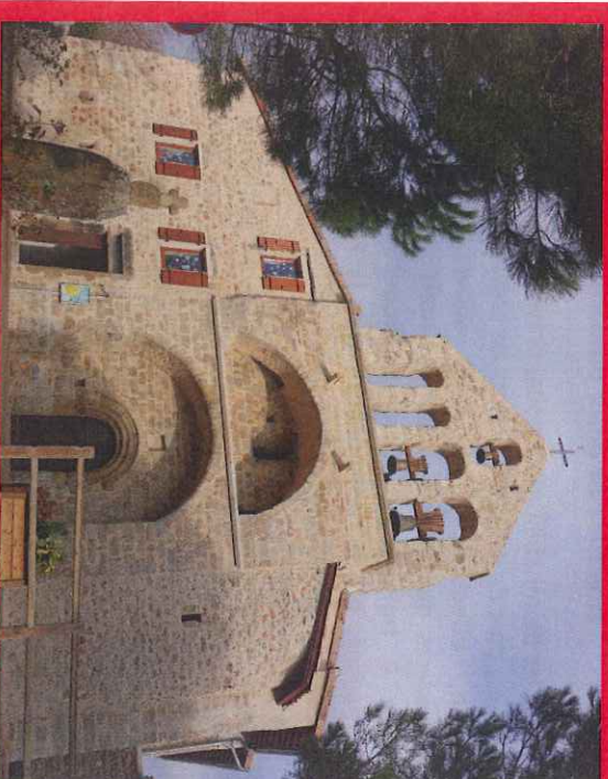
Restauration façade et clocher (2014/2015)