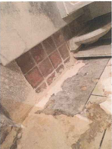
Partie du sol à reprendre

Il est également prévu la pose de dalles anciennes pour uniformiser le sol tout en gardant le caractère ancien du site.