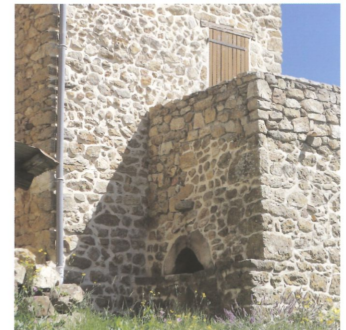
Le four à pain des HIVERES

Sentier vert : sympa, et facile pour toute la famille ! (un coup d'œil sur le Château du Pin !)