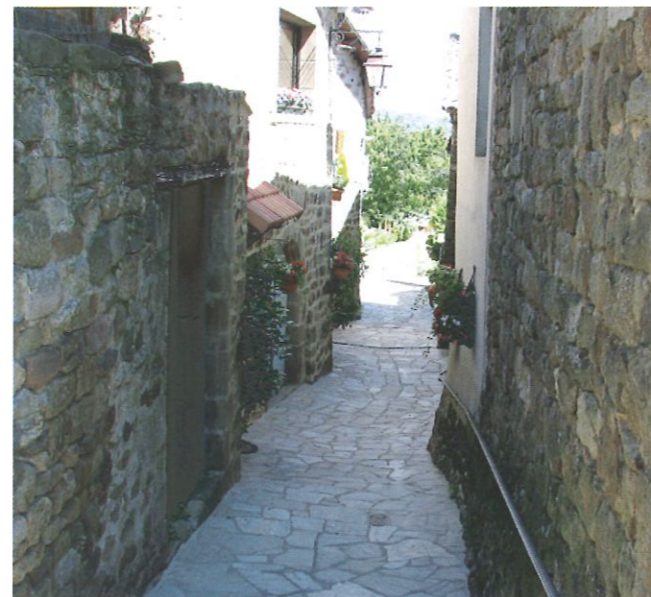
La Calade des SOULHETS

Qu'en dites - vous ? : Agréable notre sentier " rouge "... à faire cependant plutôt le matin ou en fin d'après midi et soyez bien chaussés !