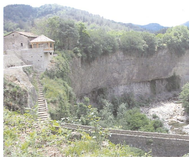
le Belvédère, le pont de l'Echelette, et les coulées basaltiques

Conclusion : Etait-elle bonne l'eau du Lignon ? Avez-vous apprécié cette balade " blanche " ?